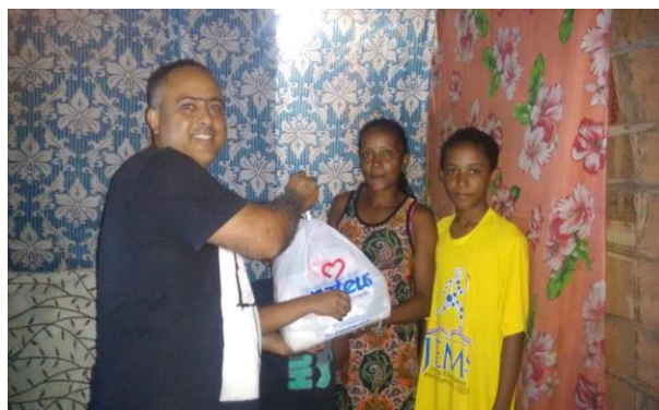
Polo Pedreiras/MA. Ação de donativo de alimentos para famílias carentes.