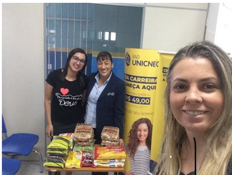
Polo de Rio Bonito/RJ. Coleta de alimentos para donativos.