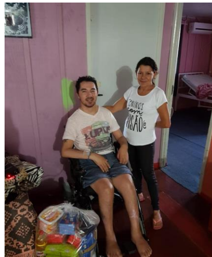
Polo Taió/SC. Ação de apoio às famílias vítimas das enchentes.