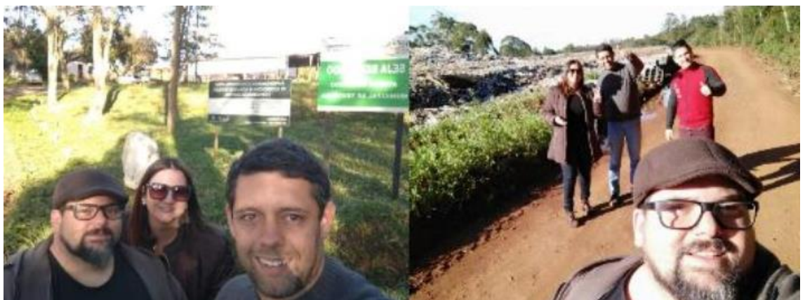
Polo Teutônia/RS. Comunidade acadêmica assistindo aos videos e visita de alunos ao aterro sanitário e Reciclagem Orgânica.