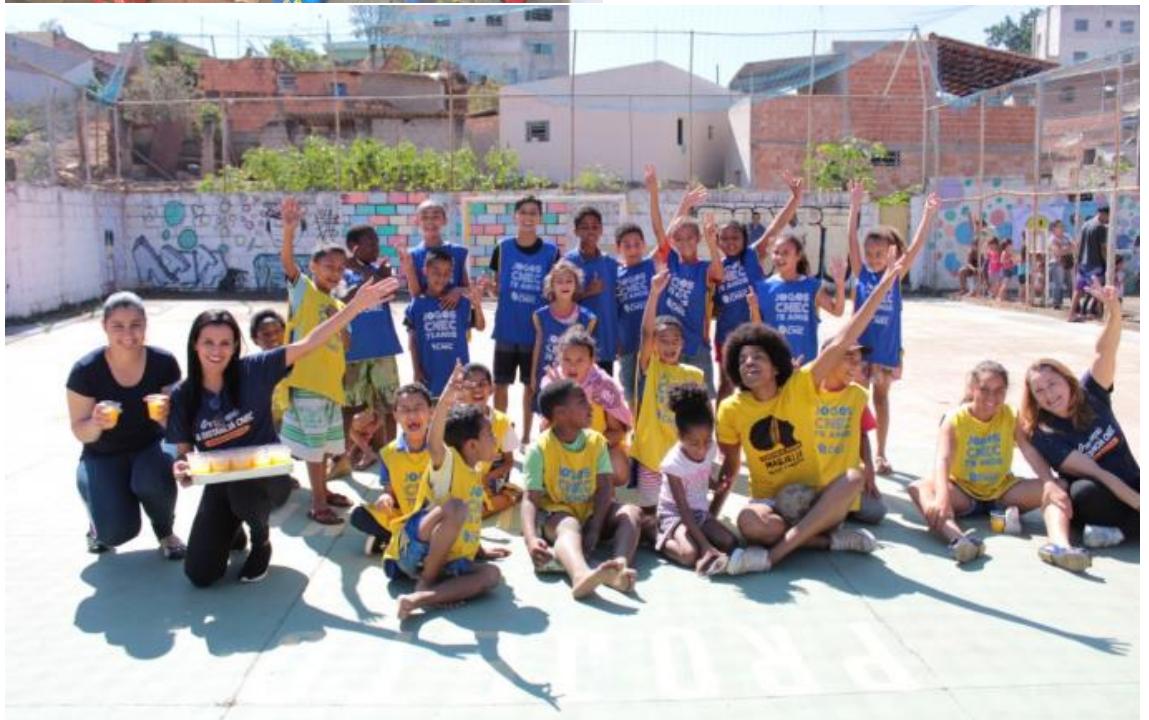
Polo de Itauna/MG em arrecadação e ação de donativo de brinquedos para crianças em situação de vulnerabilidade.

Missão Desenvolver conhecimento para a vida.