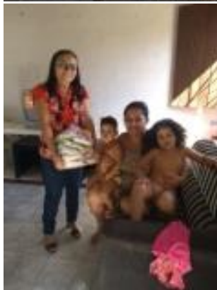
Polo Redenção/CE. Doação de cestas básicas para famílias carentes.