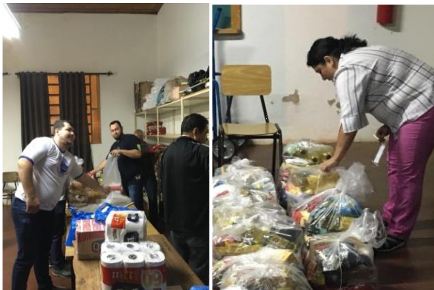
Polo Uberaba/MG. Doação de alimentos ao “Santuário Ns da Abadia”. Que atende 37 famílias carentes.

Missão Desenvolver conhecimento para a vida.