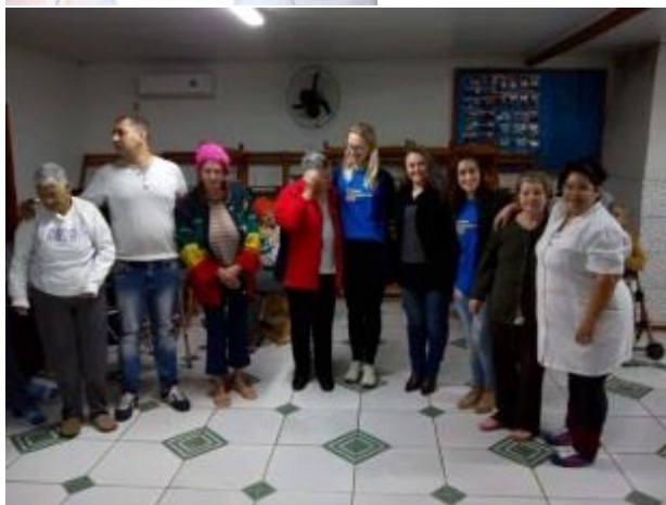
Polo Estância Velha/RS entregando donativos de agasalho para o Lar do Idoso.

Missão Desenvolver conhecimento para a vida.