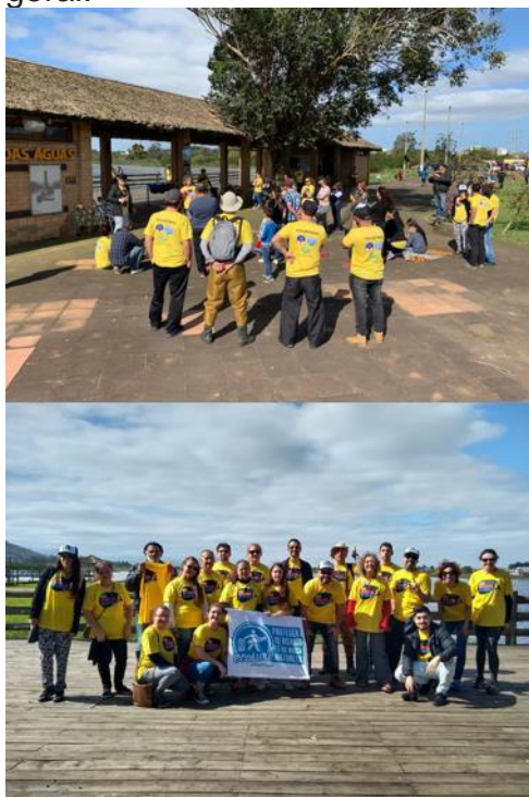
Imagem: Ação Comunitária. Limpeza de Lagoa.

Valores Ética; Excelência; Valorização do Ser Humano; Sustentabilidade; Otimização de recursos; Transparência.