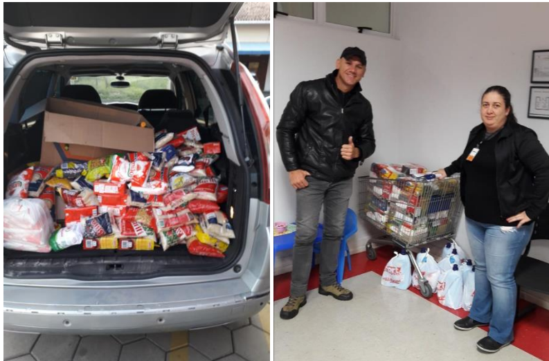
Polo Joinville/SC. Ação de arrecadação de alimentos.

Missão Desenvolver conhecimento para a vida.