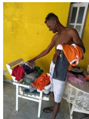
Polo São João da Barra/RJ. Ação de mapeamento das comunidades em vulnerabilidade social e donativo de roupas.

Missão Desenvolver conhecimento para a vida.