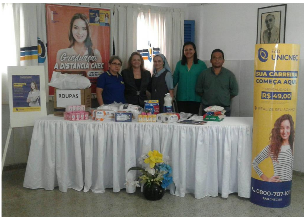
Polo de João Pessoa/PB Geisel, em ação de donativo de produtos de higiene à ASPAN.