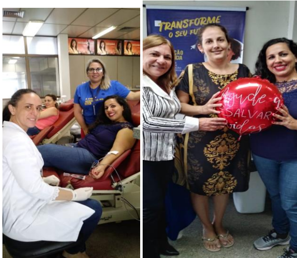
Polo de João Pessoa/PB, alunos em ação de doação de sangue.