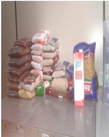
Polo Paraíba do Sul/RJ. Ação de donativo de alimentos para asilo local.