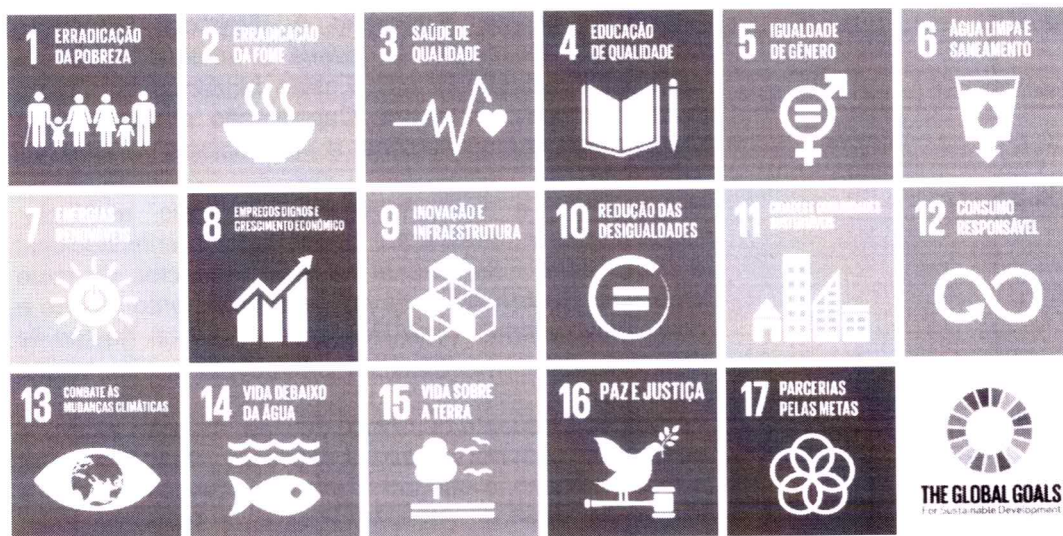
Figura1 - Objetivos de Desenvolvimento Sustentável (ODS)

A UNICNEC, como Instituição Educacional comprometida com a comunidade e, por consequência, com as gerações futuras, entende que os seus programas e projetos de extensão devem estar alinhados com os 17 Objetivos de Desenvolvimento Sustentável, contribuindo assim para o futuro da humanidade e do planeta.